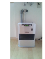
灯油ストーブ (他部屋・参照写真)

※この図面は物件情報の一部を抜粋して掲載しております。(現況優先) ※付帯条件や別途料金が発生する場合がありますのでご確認ください。